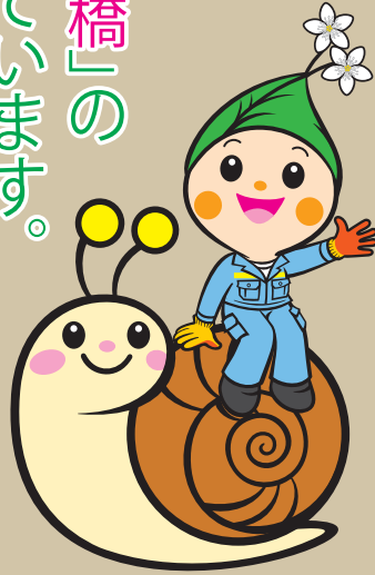
りんりんちゃん & かたつむりん