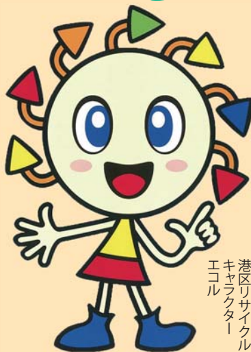
港区リサイクル キャラクター エコル