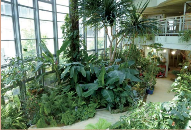
約200種の植物や水生生物を観察できるグリーンガーデン(温室)

渋谷清掃工場の還元施設として造られた植物園で、渋谷駅から歩いて約12分の都心に位置します。