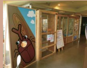
カブトムシふれあい広場

夏に開催される恒例行事で、展示ホールにある大きなカブトムシ小屋に入って、自由に手に取ったり観察することができます。カブトムシ広場で生まれた卵から育てたカブトムシも展示されます。