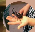
カブトムシとふれあってみよう