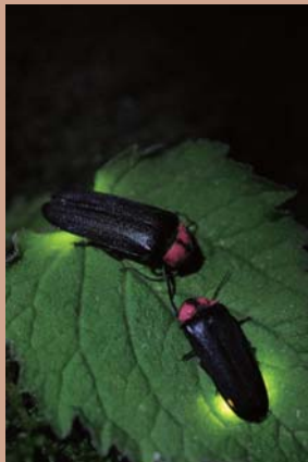
ゲンジボタル