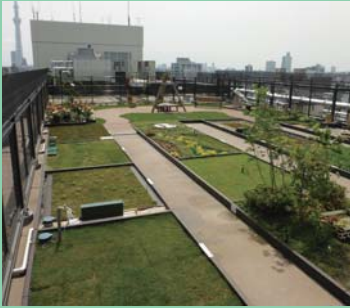
「憩いのガーデン」全景

平成25年11月、区役所本庁舎屋上モデルガーデンが「憩いのガーデン」としてリニューアル。企業の協力を得て様々な施工例を紹介するとともに、訪れた方々に緑と親しめる憩いの場を提供しています。あわせて、太陽光発電システムや家庭用燃料電池、雨水貯留槽の紹介も行っています。