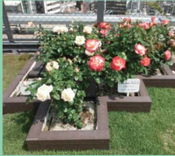
バラ園(山形県村山市より寄贈)