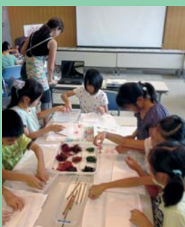
海藻おしばりがき作り

区内在住・在勤または在学の方を対象に、環境学習に関する様々な講座を実施しています。今年度も、地球温暖化の仕組みや、天体望遠鏡作り、エコな調理など12種類の講座を予定しています。環境保全活動を目的とした特定非営利法人や、環境先進技術を持つ民間企業等の専門性を活かした環境学習講座を実施しています。