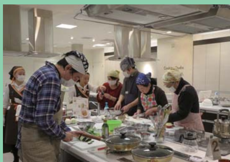
エコ・クッキング