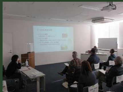
生物多様性保全推進