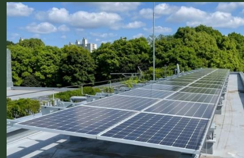
太陽光パネル設置