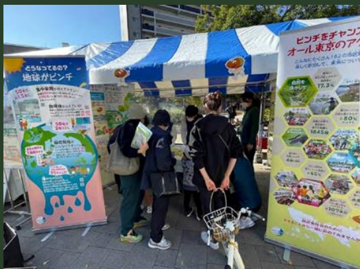
市区町村等へ主催イベントへの出展