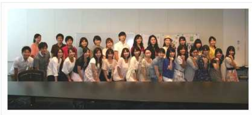
学生市民記者チーム

東京都内で活動可能な大学生・専門学校生42名を、ラジオ番組やWEBで募集し、アイドルリング!!! 20名と併せて、62名の市民記者団を結成しました。