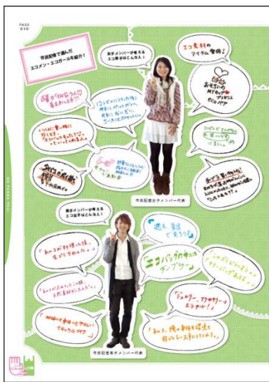
[Pick up] 持ってますか？あなたの街のエコバッグ 知ってますか？海外にも、こんなお洒落なエコバッグが！ 市民記者達が想う、エコ男子・エコ女子はこんな人！