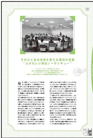
[News topic] そのひと言は未来を変える魔法の言葉”ムダなレジ袋はノーサンキュー”