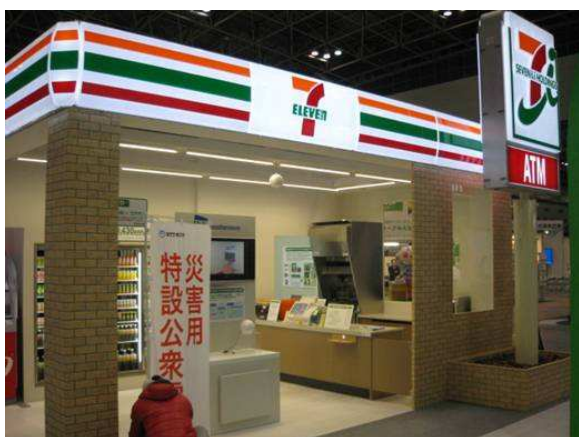
株式会社セブン&アイ HLDGS. のブース