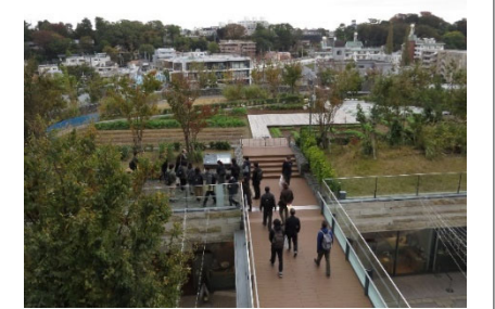
二子玉川ライズでの見学