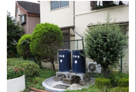
公園での雨水利用の事例見学