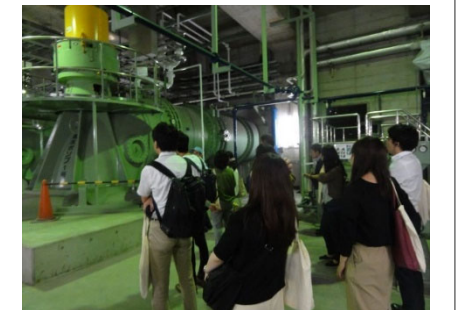
ポンプ場での見学