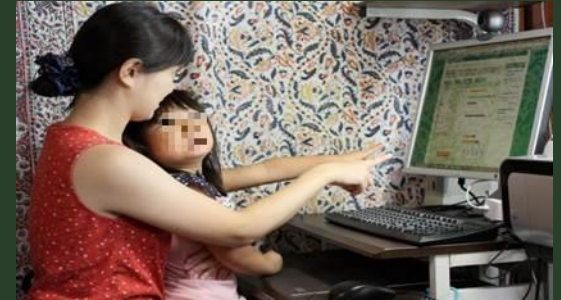
家庭での省エネ推進