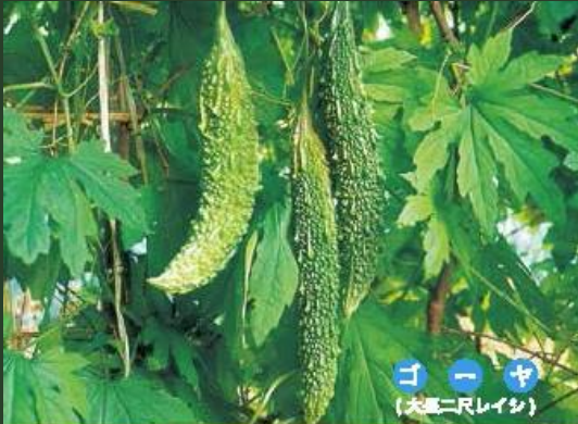
ゴーヤ (大玉二尺レイシ)