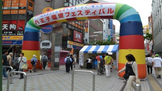
環境フェスティバルの開催