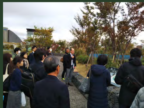
見学会（グリーンインフラ）