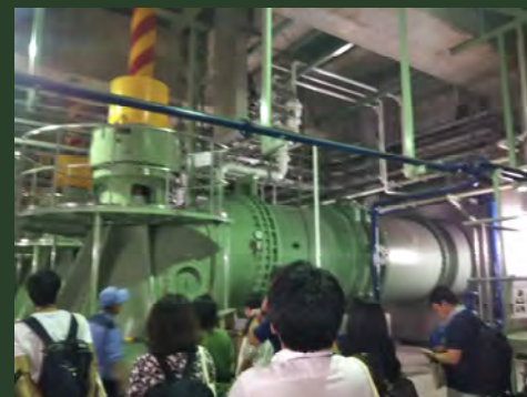
見学会 （雨水利用、浸水被害対策）