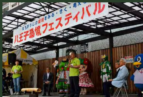
環境フェスティバルの開催