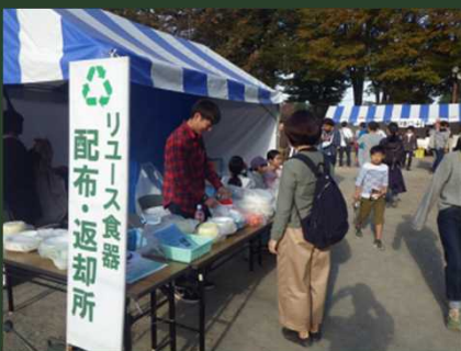
リユース食器使用推進